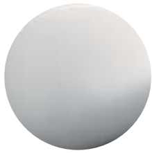
CR Cromo • Chrome Cromo