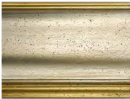
AM Argento Mecca Silver Mecca • Plata y dorado