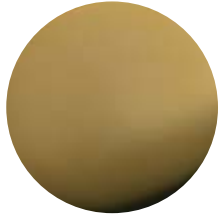
ON Ottone naturale • Natural brass Latón natural