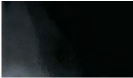
Nero Lucido • Shiny Black Negro brillante