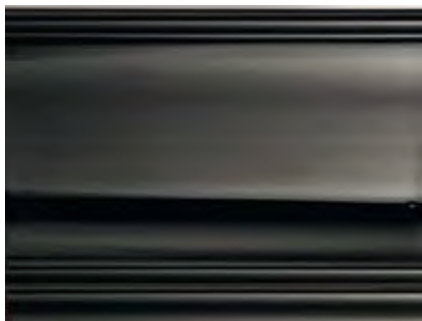
NL Nero Lucido Shiny Black • Negro brillante