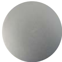
NIO Nichel opaco • Matt Nickel Níquel mate