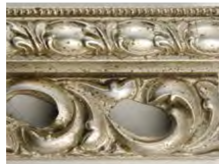
AI Argento Invecchiato Antique Silver • Plata Antiguo