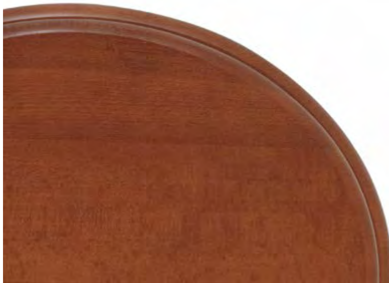
Sedile faggio tinto ciliegio • Cherry stained beech seat Asiento haya tinta cerezo