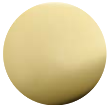
OR Oro • Gold Dorado