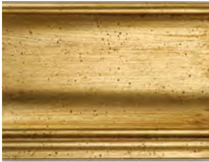
OI Oro Invecchiato Antique Gold • Dorado Antiguo