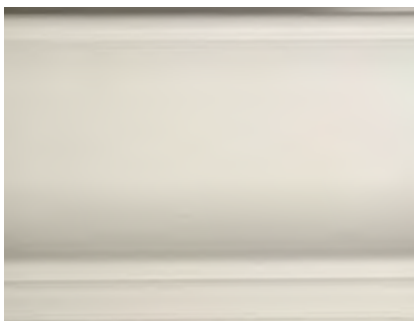
BO Bianco Opaco Matt White • Blanco mate