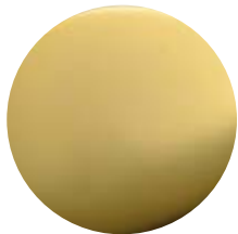
OL Oro light • English gold Oro claro