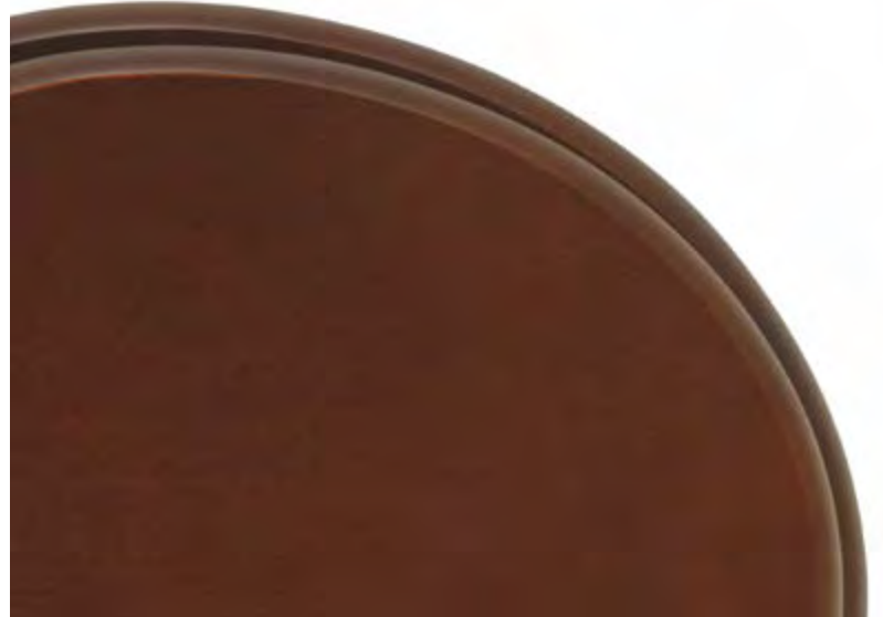
Sedile faggio tinto noce • Walnut stained beech seat Asiento haya tinta nuez