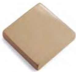
02 - Caramello