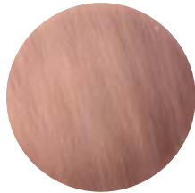
RAO Rame opaco • Satin Copper Cobre mate