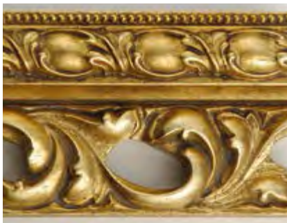
OI Oro Invecchiato Antique Gold • Dorado Antiguo