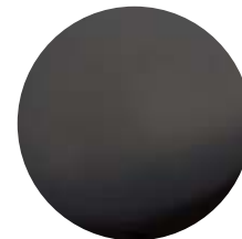
NN Nichel Nero • Black nickel Níquel negro