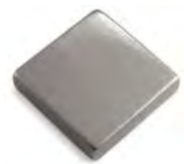
06 - Taupe