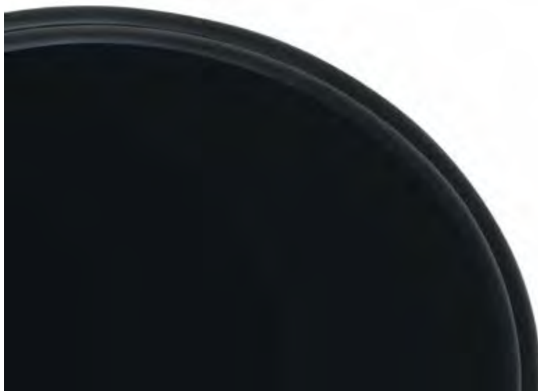
Sedile Nero opaco • Satin black seat Asiento negro mate