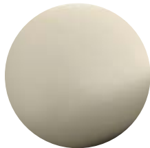
NI Nichel • Nickel Níquel