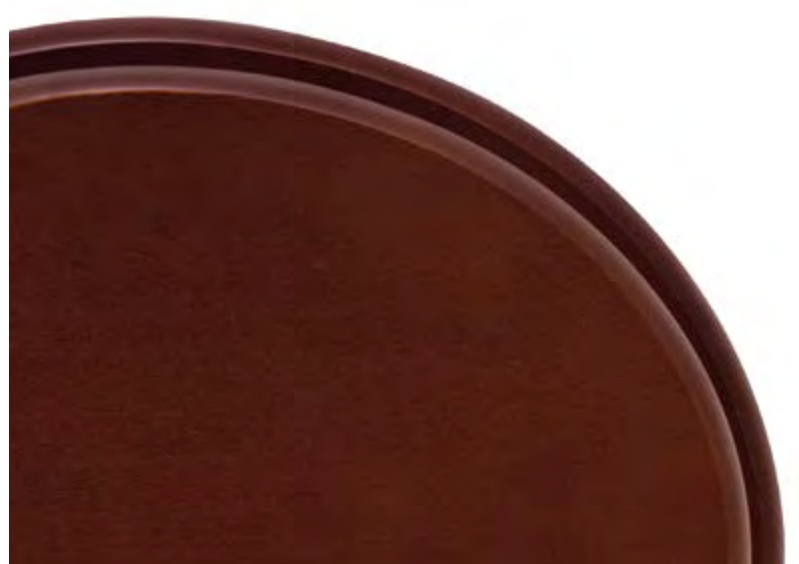
Sedile legno mogano • Mahogany stained ash seat Asiento ceniza tinta caoba