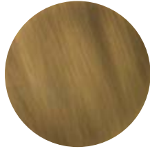
BT Brunito • Burnished Bruñido