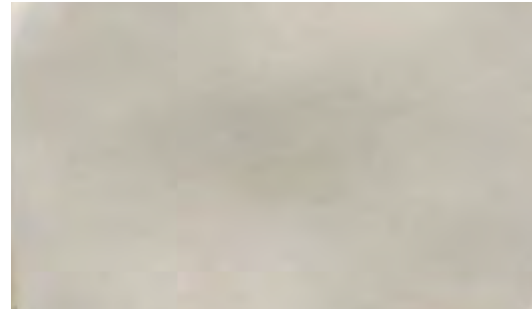
Platino • Platinum Platino