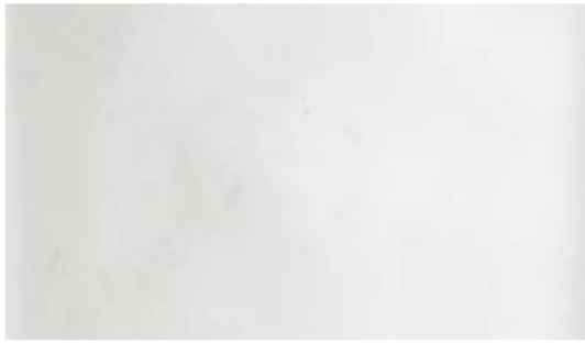
Bianco • White • Blanco