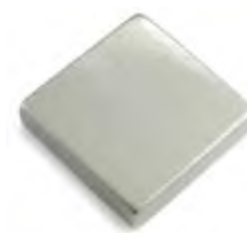
05 - Perla