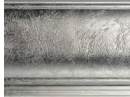
AG Argento Grinzoso Wrinkled silver • Plata arrugado