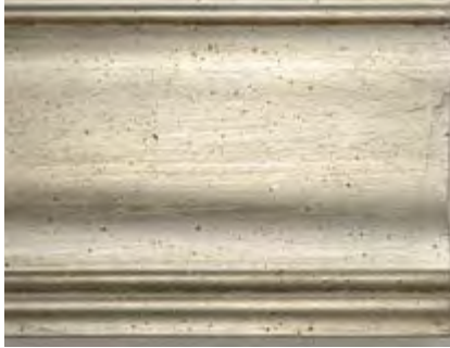
AI Argento Invecchiato Antique Silver • Plata Antiguo