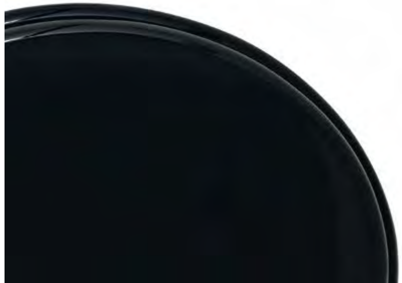
Sedile Nero Lucido • Shiny black seat Asiento negro brillante