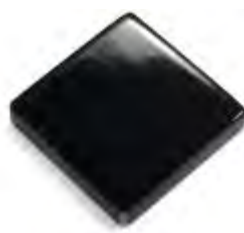
03 - Fosco