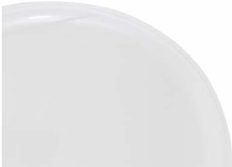
Sedile bianco White seat Asiento blanco