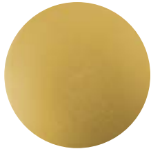
OO Ottone opaco • Matt brass Latón mate