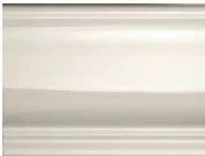
BL Bianco Lucido Shiny White • Blanco brillante