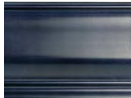
GR Grigio Piombo Dark Grey • Gris plomo