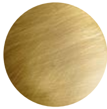
BR Bronzo • Bronze bronce