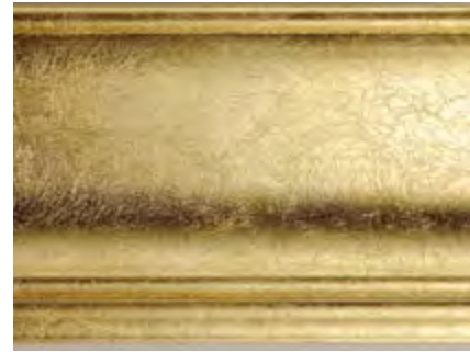
OG Oro Grinzoso Wrinkled Gold • Dorado arrugado