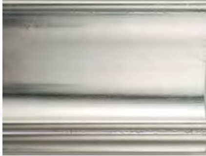
AR Argento Silver • Plata