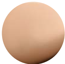
ORR Oro rosa • Rose Gold Dorado rosa