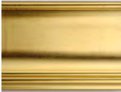
OR Oro Gold • Dorado