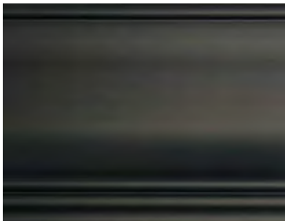
NO Nero Opaco Matt Black • Negro mate