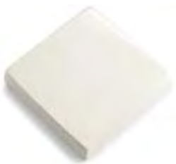
01 - Biancospino