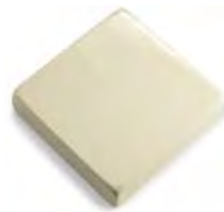
04 - Avorio