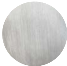
NIS Nichel spazzolato lucido • Shiny brushed Níquel cepillado brillante